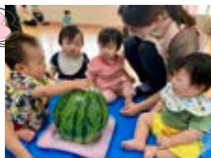
こおり、溶けてきたね